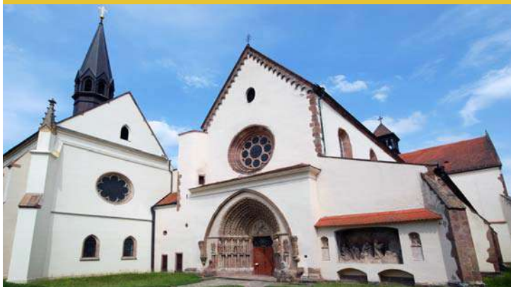
Porta Coeli zárda

2. nap: Reggeli után indulás Olmützbe - séta a belvárosban. Olomouc (Olmütz) Csehország egyik legszebb városa fallal körülvett nagy kiterjedésű központjával, számtalan gyönyörű templomával, hangulatos tereivel, barokk szobraival, szökőkútjával. Gyönyörű főterén a Világörökség részeként számon tartott Szentháromság-ország, impozáns városháza csillagászati órával és gótikus templomai láthatóak. Olmützből indulunk Policka városába. A történelmi Csehország és Morvaország határán fekvő települést II. Premysl Ottokár cseh király - nem mellékesen IV. Béla királyunk Kunigunda nevű unokájának férje - parancsára alapították. A helyi sörfőzés az 1517-es Szent Vencel-napi egyezmény megkötése után virágzott fel.